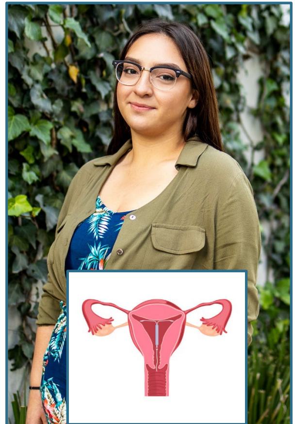
Este DIU se coloca en el útero.