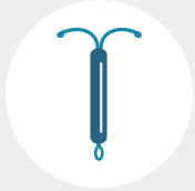
Dispositivo intrauterino (DIU)