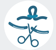
Anticonceptivos permanentes (ligadura de trompas y vasectomía tubárica)