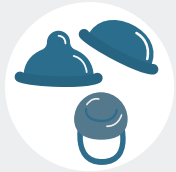
Diafragma, capuchón cervical y esponja