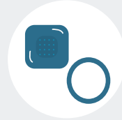
Parche anticonceptivo y anillo vaginal anticonceptivo