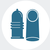
Condón externo e interno